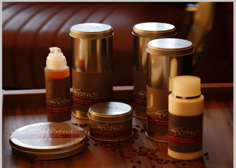
San Vlno Herrenkosmetik